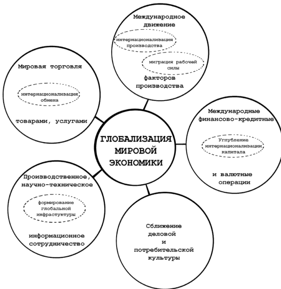
Рис. 2. Глобализация мировой экономики

кратии позволяют капиталу молниеносно перемещаться в любые страны мира, не только в передовые и демократические, а во все, где созданы необходимые условия: стабильное политическое устройство и наиболее многообещающие прибыли. Имеется в виду, что бедные и недемократические страны также сумеют найти свою нишу в мировом производстве, опираясь не на косные правительства, а на чувствительные к переменам и нововведениям частные компании.